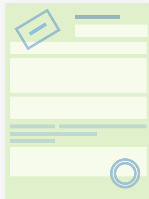
Страховой полис ОСАГО с электронной подписью

После оплаты в ваш личный кабинет и на e-mail придут электронные документы, которые вы можете распечатать: